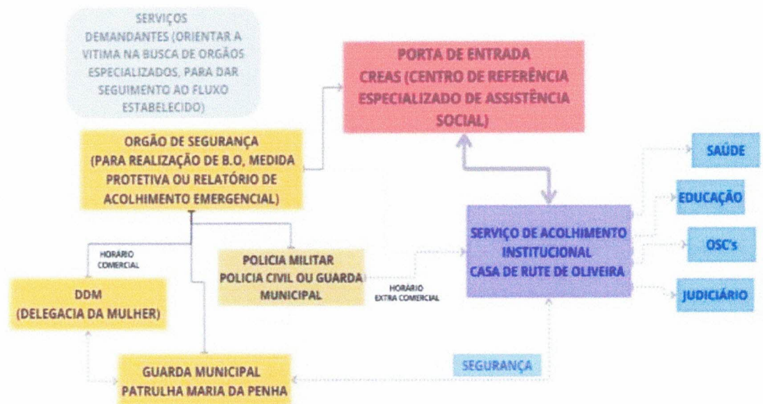
ORGANOGRAMA DO FLUXO DE ATENDIMENTO DO SERVIÇO DE ACOLHIMENTO INSTITUCIONAL CASA DE RUTE DE OLIVEIRA - SÃO MANUEL/SP

O Serviço de Acolhimento possui como parâmetro, articular com o CREAS previamente o desligamento das mulheres e posteriormente realizar o acompanhamento, visando evitar a reincidência de acolhimento.